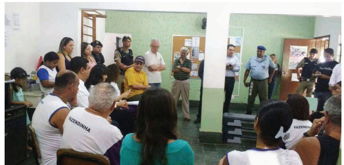
Reunião com os grupos locais no Espaço Cevae Coqueiros

(Fazendinha). Participaram do encontro os representantes dos grupos de convivência: Horta Comunitária, Academia da Cidade e Grupo Cuca Legal, além de representantes da Escola Padre Massote, Areb, PBH e do Ministério Público.