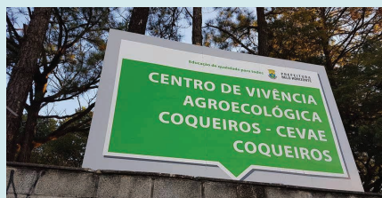
Placa no terreno destinado às obras

A construção do Centro de Saúde Coqueiros é, também, uma vitória para os usuários e trabalhadores do Centro de Saúde do bairro Glória que, recentemente, protestaram contra a falta de segurança, estrutura precária e